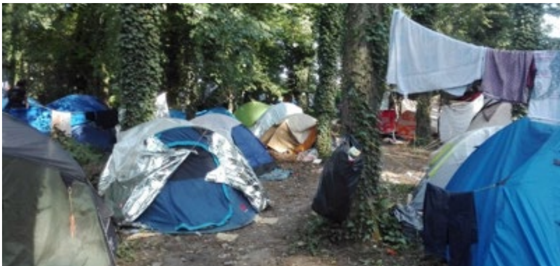
Camp à Grande-Synthe, août 2018

Les autorités ont mis en place un service régulier de maraudes pour permettre aux étrangers d'accéder à des centres d'accueil et d'examen des situations (CAES) ou des centres d'accueil et d'orientation (CAO), où ils peuvent également obtenir des informations sur la procédure d'asile. Les autorités françaises affirment que grâce à ces maraudes, tous les migrants et réfugiés à la rue peuvent être mis à l'abri et que personne n'est contraint de dormir dehors 19 .