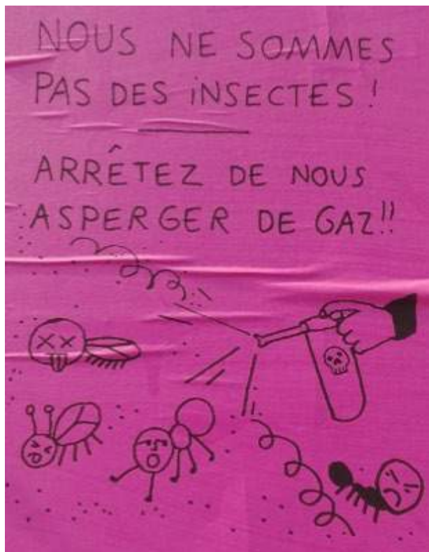
« Nous ne sommes pas des insectes ! Arrêtez de nous asperger de gaz ! » Affiche photographiée à Calais, juillet 2018