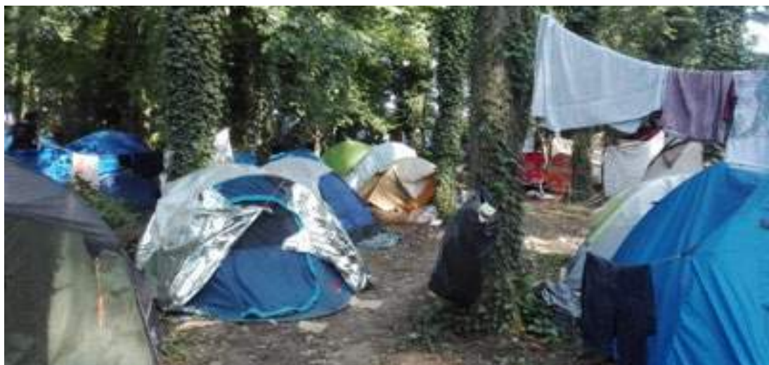
Camp à Grande-Synthe, août 2018

Les autorités ont mis en place un service régulier de maraudes pour permettre aux étrangers d'accéder à des centres d'accueil et d'examen des situations (CAES) ou des centres d'accueil et d'orientation (CAO), où ils peuvent également obtenir des informations sur la procédure d'asile. Les autorités françaises affirment que grâce à ces maraudes, tous les migrants et réfugiés à la rue peuvent être mis à l'abri et que personne n'est contraint de dormir dehors 19 .