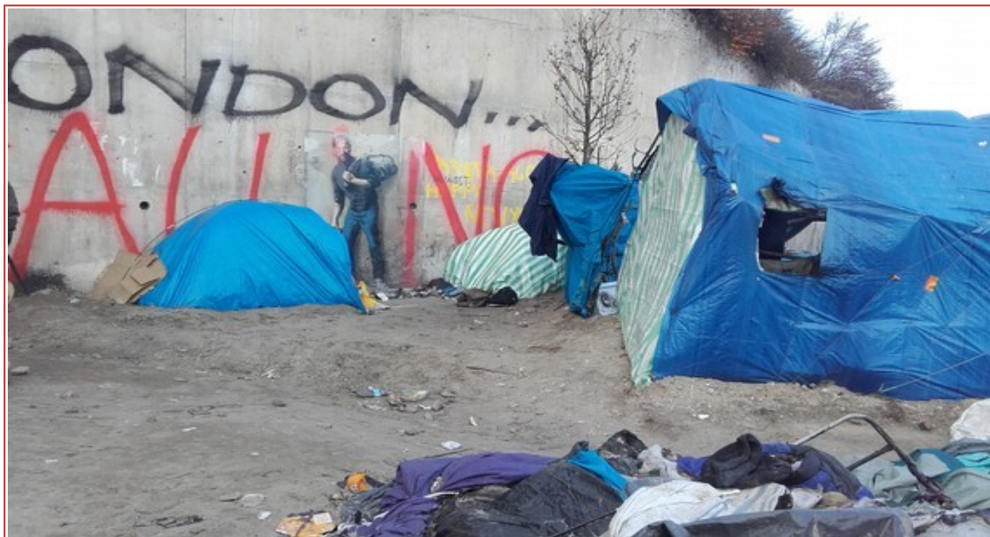
Steve Jobs dans la peau d'un migrant- Fresque de « Banksy »