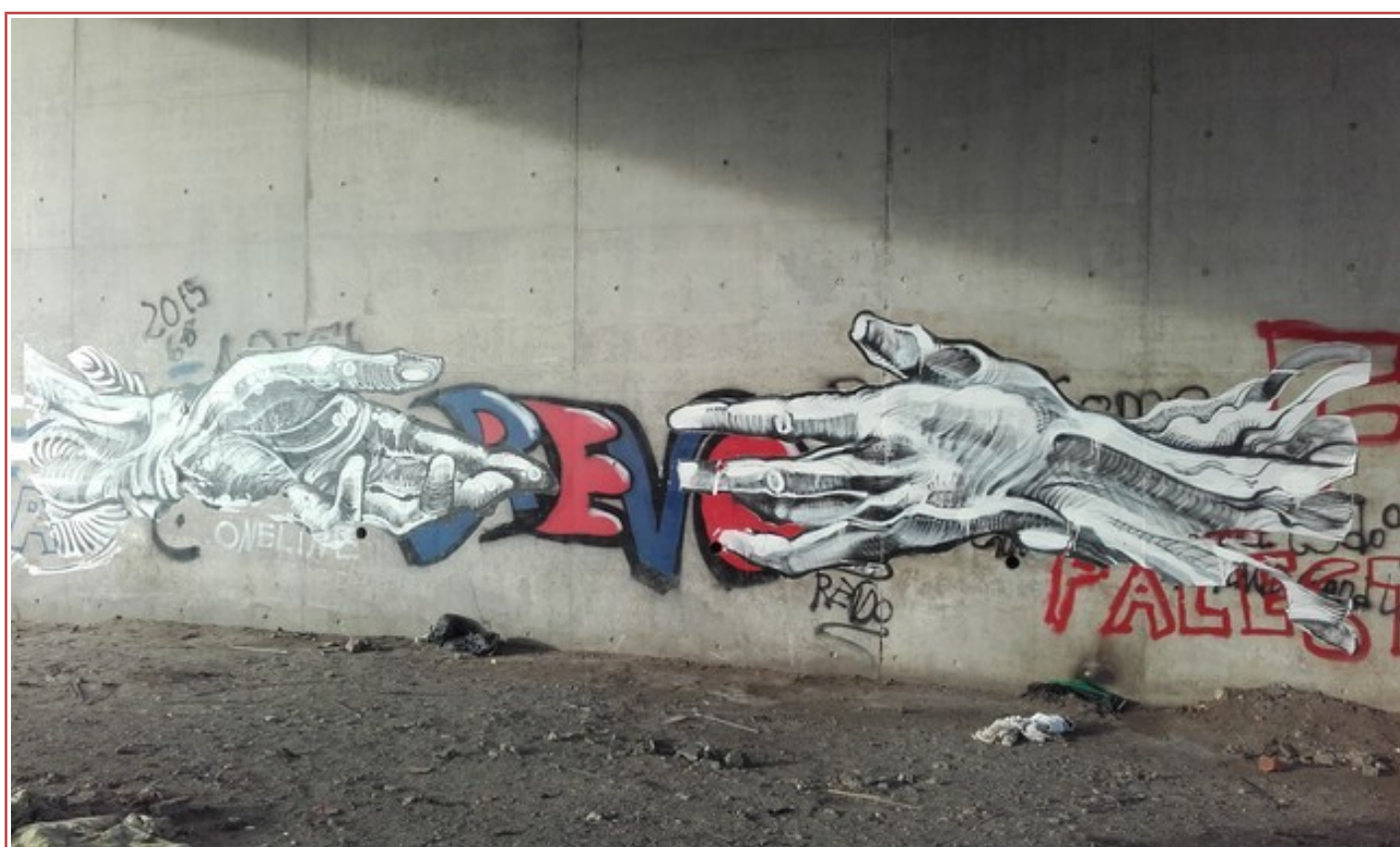
« Sous le pont au bout de la rue des Garennes » Fresque de « Banksy »

Merci à : « Un mouvement pour la dignité humaine » de nous avoir autorisé à utiliser leurs photos