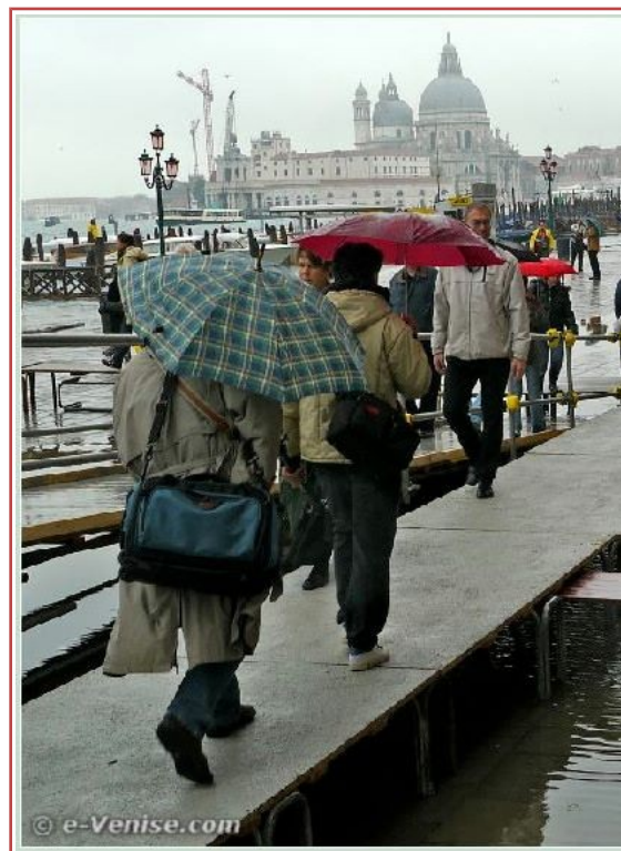
Acqua alta à Venise