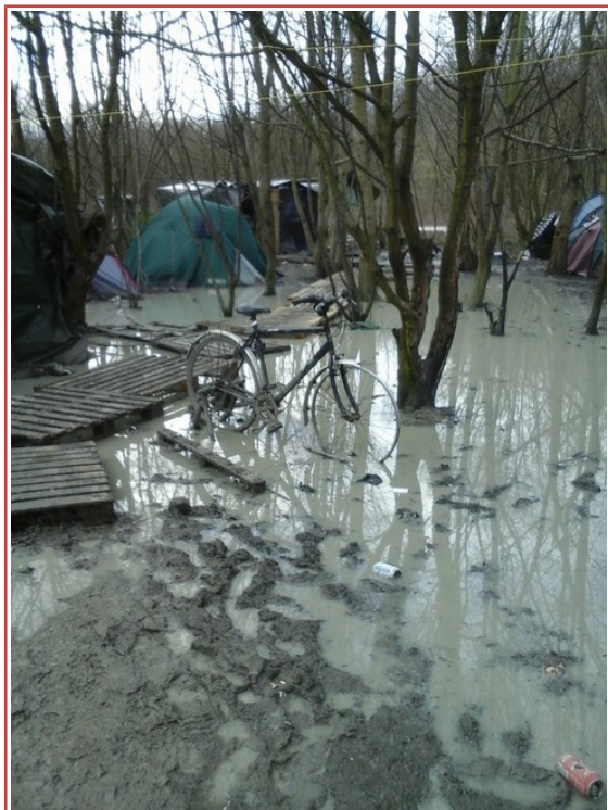
Acqua alta à Grande-Synthe