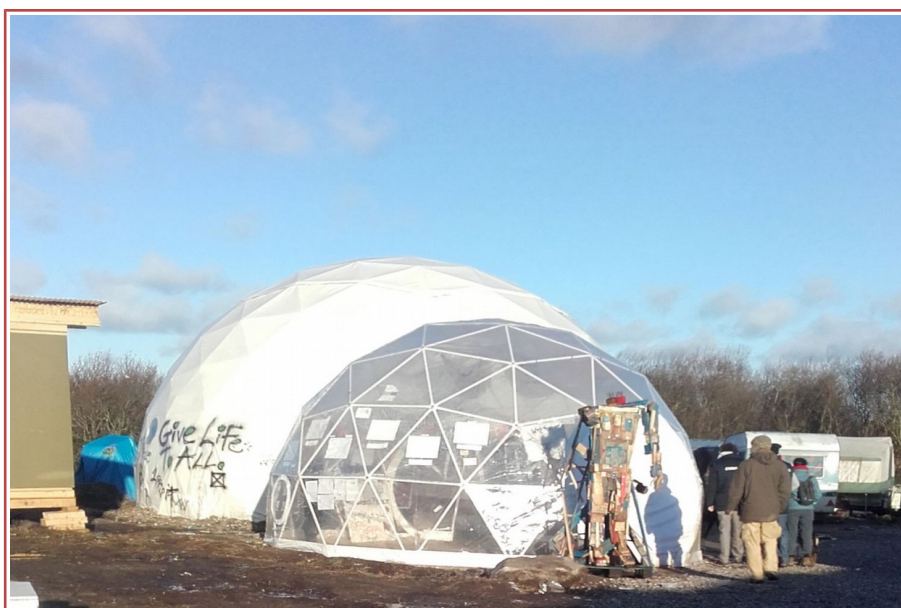
Le dôme qui accueille les spectacles de théâtre